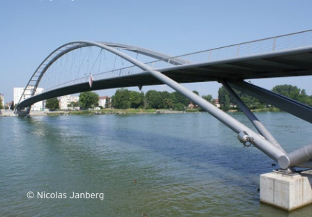
Fußgängerbrücke Weil am Rhein

Die Gesamt-Preisverleihung findet im März/April 2013 statt. Über den Veranstaltungstag und -ort wird Euch die jeweilige Ingenieurkammer informieren.