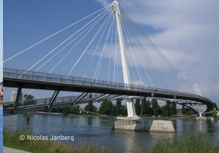
Passerelle des Deux Rives