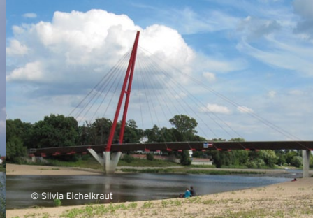
Brücke am Wasserfall