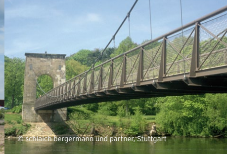
Drahtbrücke über die Fulda

© schlach bergermann und partner; Stuttgart